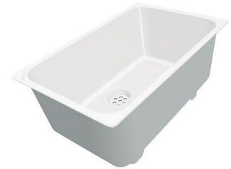
Weißer Wanne 8153 100