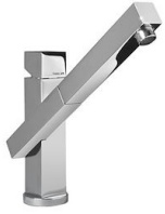
Mischbatterie Twix Plus